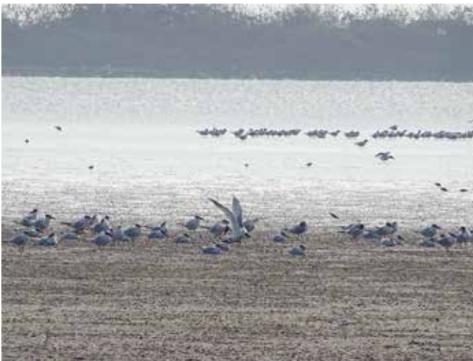
燕鷗—臺南，七股

那麼，伴隨我們數十年的「生活障礙」，要到什麼時候才能適度解封呢？臺灣要到什麼時候才能真實貫徹 CRPD 的基本精神？