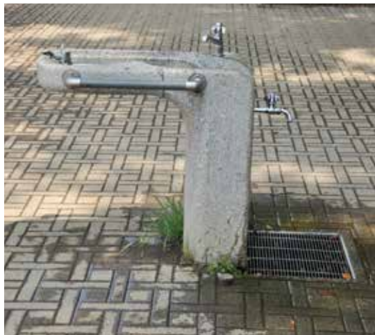
日本上野公園—飲水機設計（20140725） 比較臺北市的設計大同區景化公園—自飲 臺（20210503）