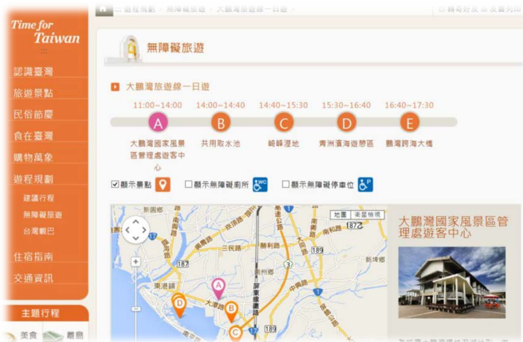
交通部觀光局無障礙旅遊資訊畫面