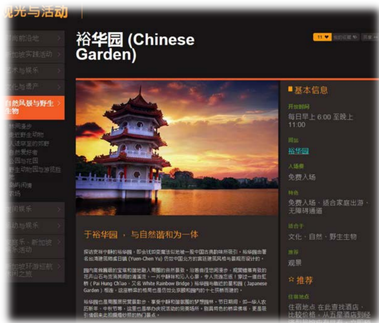
新加坡旅遊局無障礙旅遊資訊畫面