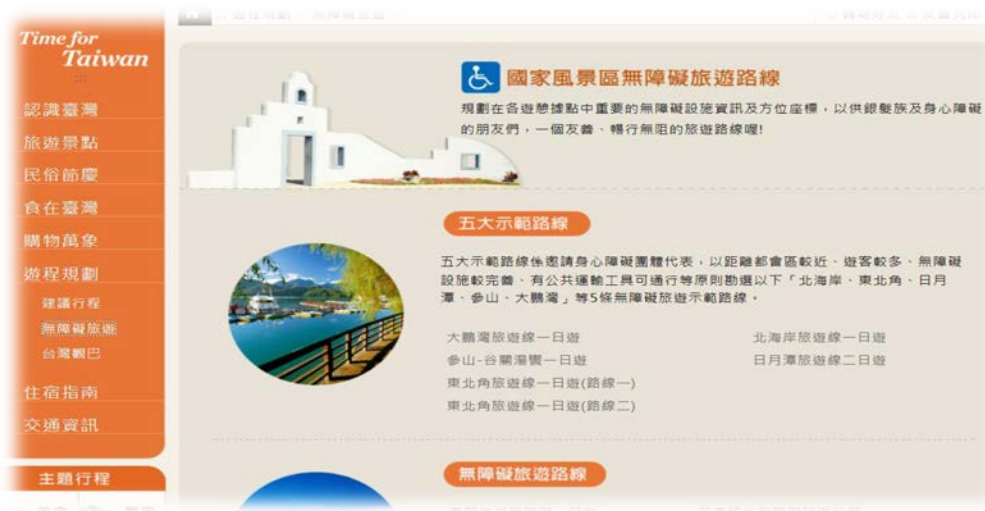
交通部觀光局無障礙旅遊資訊畫面