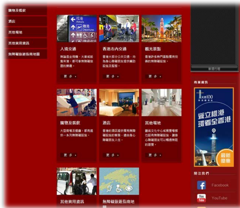
香港旅遊發展局無障礙旅遊資訊畫面