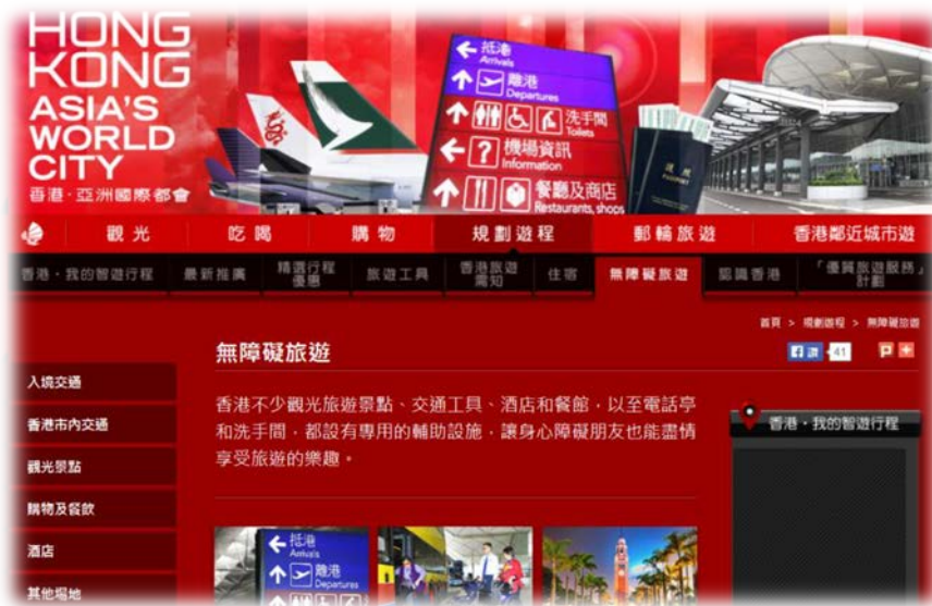
香港旅遊發展局無障礙旅遊資訊畫面

康復數碼網絡、運輸署的殘疾人士公共交通指南、易達旅遊、《無障礙去街 Guide》、無障礙旅遊指南地圖等連結，作為無障礙旅遊參考。