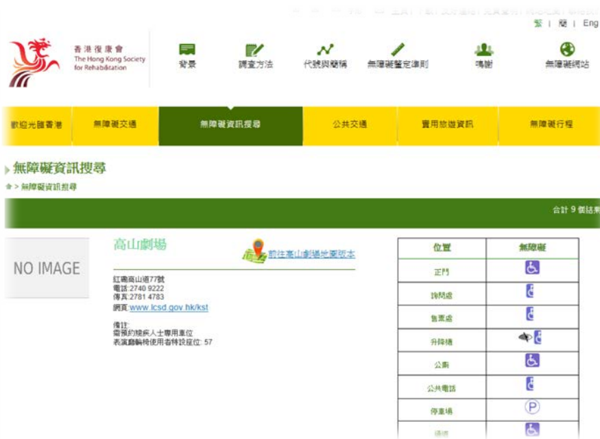
香港旅遊發展局連結外部無障礙旅遊網站資訊畫面